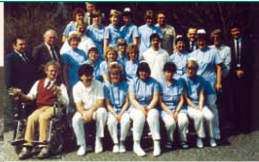
der Schulleiter ...