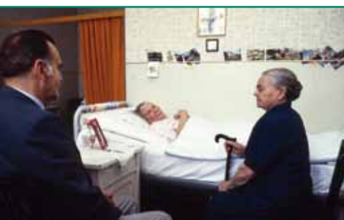
der Seelsorger ...