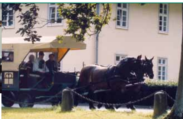
der Kutscher ...