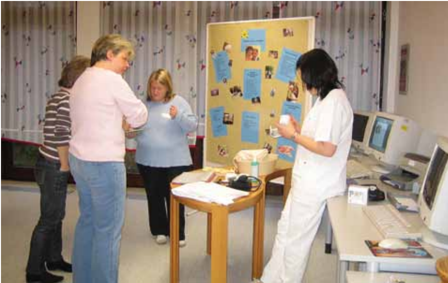
Profitieren voneinander: Altenpflegeschüler und Ergotherapeuten in Ausbildung

An der Altenpflegeschule am Gesundbrunnen lernen zukünftige Altenpflegerinnen und -pfleger ihr Handwerk. Seit anderthalb Jahren besteht eine Kooperation mit der Schule für Ergotherapie in Lippoldsberg. Der Grund: In therapeutischen und pflegerischen Berufen gibt es viele Überschneidungen.