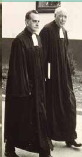
der Pfarrer ...