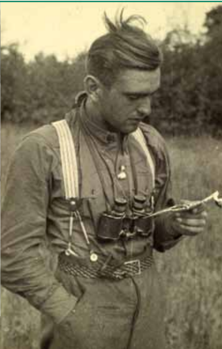
der Soldat ...