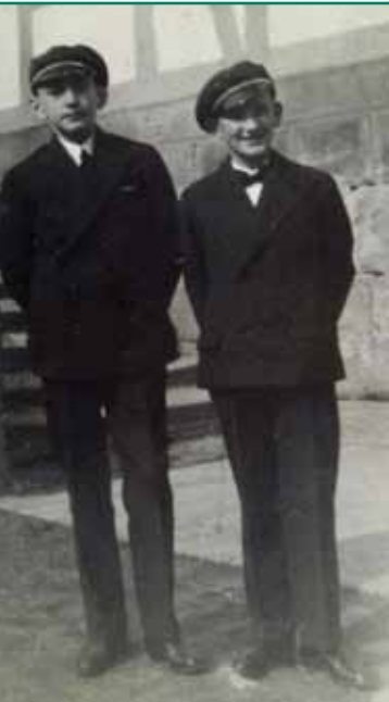
Der Schüler ...