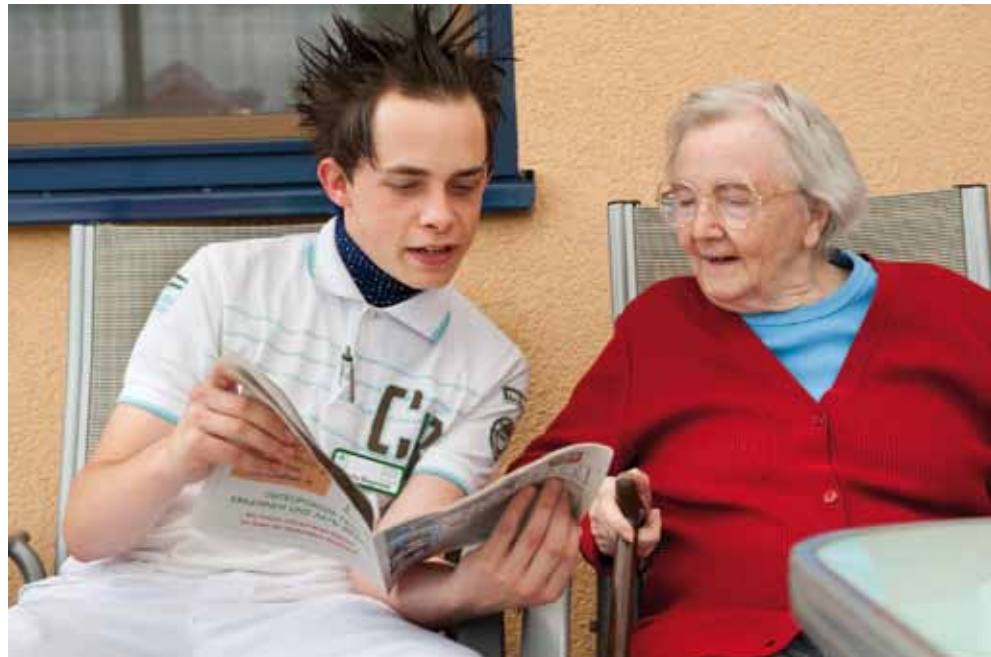
Wenn die Themen stimmen: Zeitunglesen baut Brücken zwischen Generationen

Mehrheit sitzen wir heute an den Schaltstellen. Dort, wo entschieden wird, wie das Bild des Alters aussieht. Wer im Medienbereich, beim Fernsehen, bei der Tageszeitung, beim Radio, in der Werbebranche arbeitet, kann an den Stellschrauben drehen, kann das Bild des Alters verändern.