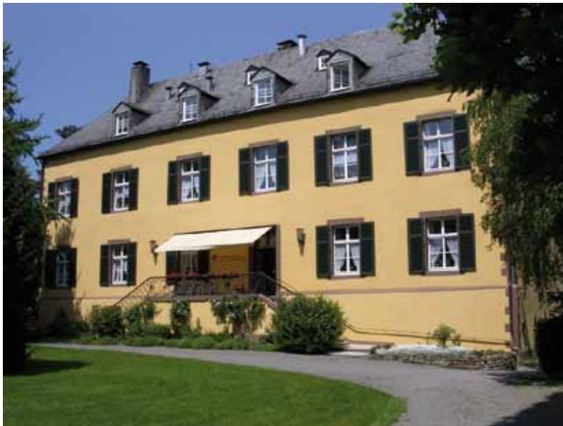
Das Schloss im Wandel: Bürgerhaus, Betreutes Wohnen, Pflegehotel

Schloss Landau bei Bad Arolsen ist seit rund 60 Jahren ein Heim für alte Menschen. Jetzt soll es einen neuen Charakter erhalten: Es soll Bürgerhaus werden – zum einen ein Ort, an dem alte, aber rüstige Menschen selbstständig leben. Und zum anderen ein Ort, an dem sich dörfliches Leben abspielt.