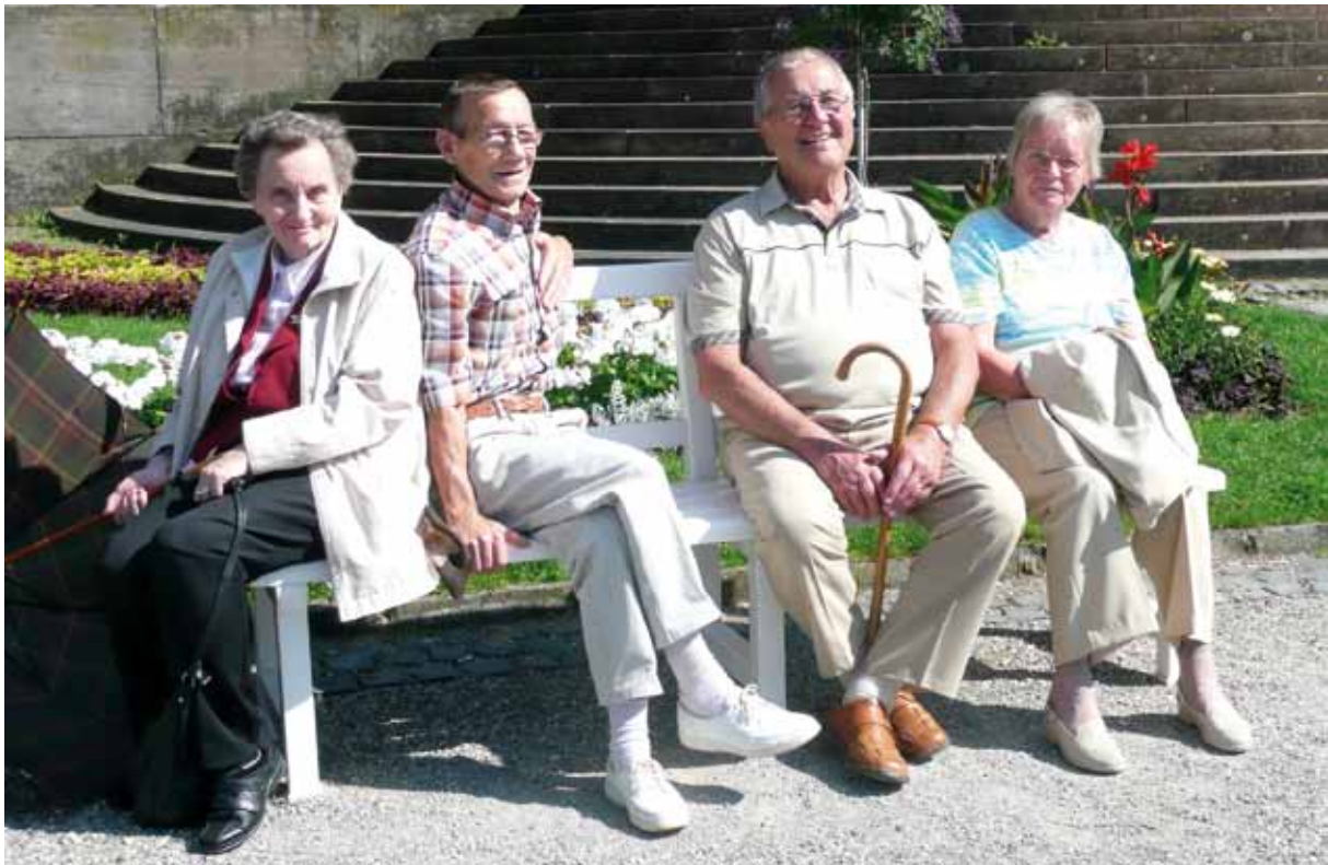
Mitglieder des Freundes- und Förderkreises bei einem Ausflug nach Kassel zum Schloss Wilhelmshöhe